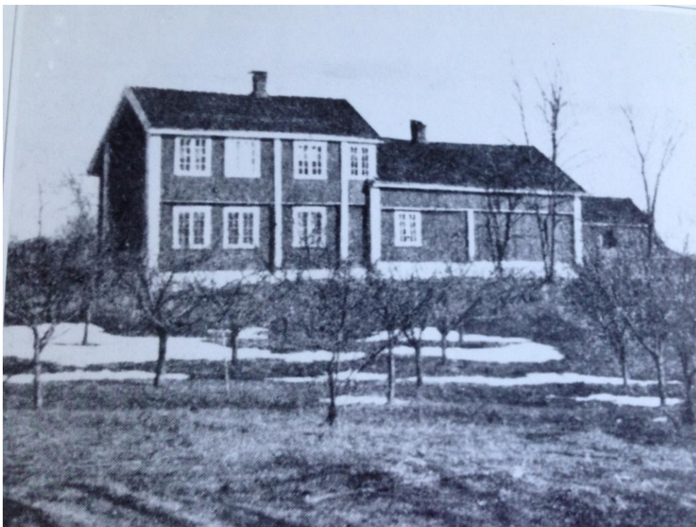
Foto: Stokker gård, avbildet i Asker: Bidrag til bygdens gaardshistorie av Halvard Torgersen

Stokker (gnr. 37) (tidligere Stokkar – flertall av stakk) er sannsynligvis ryddet samtidig med nabogården Staver – og tidligere enn Groset. Det er gamle gravhauger på eiendommen. Gården var i lenge eid av Lier prestegjeld, og drevet som leilendingsgods av slekten Stokker. I 1791 ble gården overtatt av forsvaret og gjort til kompanisjefsgård. Askers første ordfører,