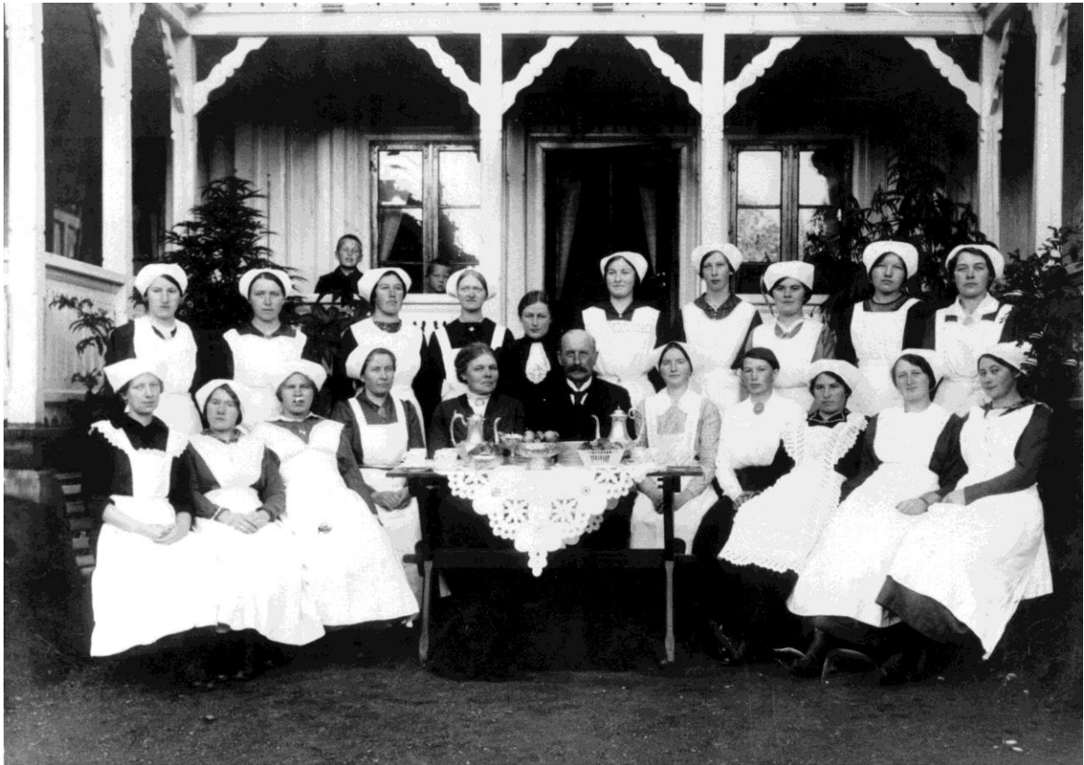
Berger husholdningsskole ca. 1916.