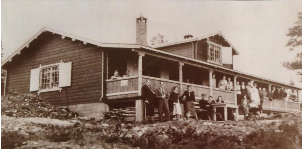
Grosetkollen sportskafé. Prospektkort: Benkow Stabekk.

I moderne tid har det vært en sportskafé her. Den brant ned, og er ikke bygd opp igjen.