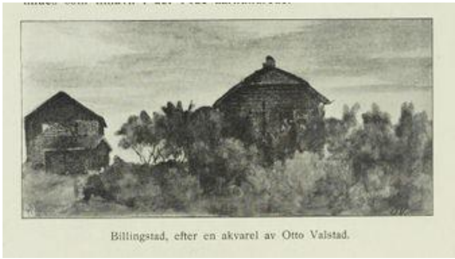
Foto: Akvarell av Otto Valstad, avbildet i Asker: Bidrag til bygdens gaardshistorie av Halvard Torgersen

I år 1000 var det fire gårder på Billingstad: Billingstad. Groset. Stokker og Åstad. 6000 år tidligere var det bare ei lita øy – Biljan – som dukket opp av havet der Tømte ligger. Det var et oppkomme på øya. Kanskje denne øya var lett å finne for fangstfolk som kom med båt? Kanskje øya var et godt utgangspunkt for jakt og fiske?