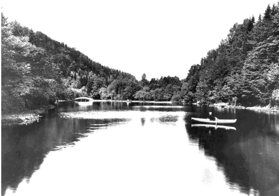
Åstaddammen ca. 1912.

Åstad gnr. 35 ligger på en ås, men navnet kommer visstnok fra navnet Odd. Åstad har vært kirkegods under navnet Oddstadir, senere Odsta. På gården er det funnet et jernsverd og en stor bronsering. Det har sannsynligvis vært bosetning på gården siden jernalderen. I Åstadskogen ligger en tydelig hulvei som var den gamle ferdseisveien fra Lier via Skaugum i retning Tanum. Åstad var i en periode en del av Nesøygodset under Rosenkrantzene. Gården ble frikjøpt i 1726 av selveiende bonde, og har senere hatt flere eiere. Det har vært både sag og mølle i Stokkerelva på Åstads grunn, og isproduksjon i dammen.