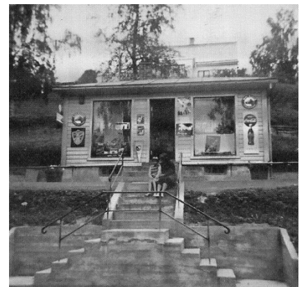
Bilde er fra 1940-årene

Etter krigen var det mange fra sykehusene som kom og handlet og pratet før det ble kiosk inne på Dikemarkområdet.